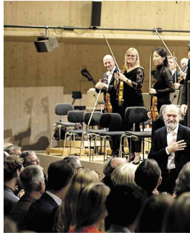
Esimese teosena kõlas Paavo Järvi juhatamisel Arvo Pärdi «Kui Bach oleks

Sama kavaga kontserdid toimusid veel 3. ja 4. oktoobril Tonhalle Maagi moodsas ja askeetlikus, kuid suurepärase kõlaga ja 1224 kuulajat mahutavas kontserdisaalis. See kunagisse tööstuspiirkonda Tonhalle orkestrile ehitatud ajutine kontserdimaja on muusikute koduks 2021. aasta märtsini. Täpselt nii kaua kestavad ulatuslikud renoveerimistööd Zürichi järve ääres asuvas kontserdimajas. Selle 1895. aastal valminud hoone avas toona Brahms isiklikult.