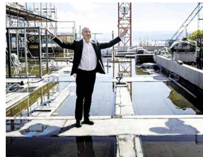
Tonhalle orkestri uuenevas kontserdimajas saab imetleda vaadet Zürichi järvele ja Alpidel.