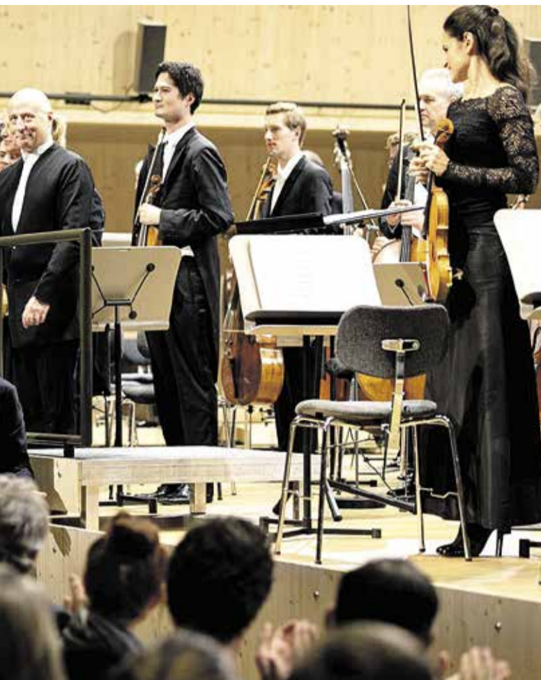
mesilasi pidanud...» uusversioon.